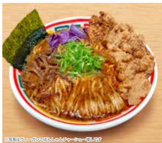
※写真はヴィーガンこぼんしゃんチャーシュー増しです