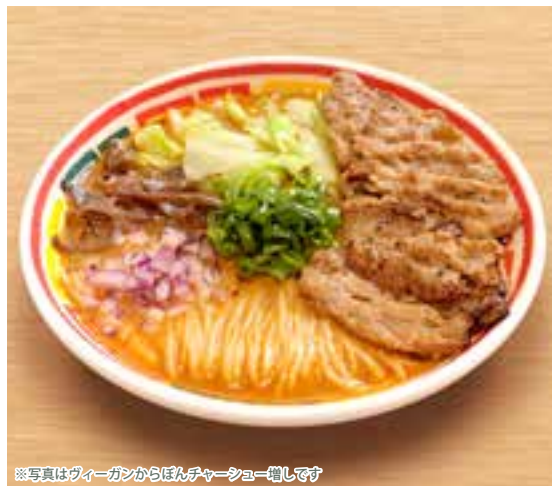
※写真はヴィーガンからぼんチャーシュー増しです