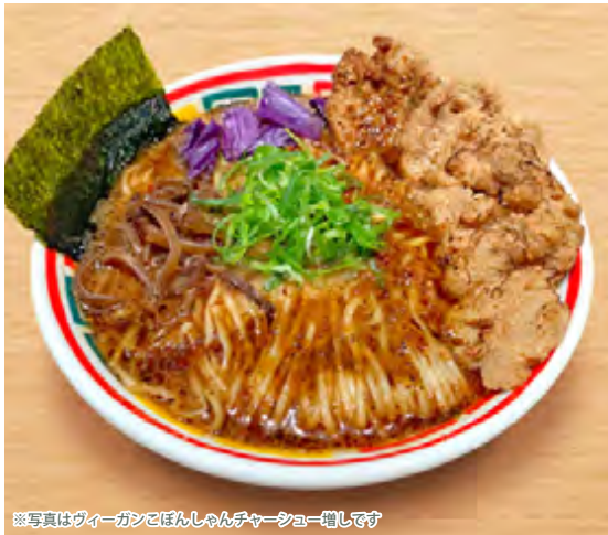
※写真はヴィーガンこぼんしゃんチャーシュー増しです