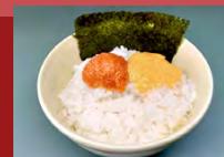
めんたいごダブルごぼん (のり付き) Vegan Mentaiko Double Rice with seaweed