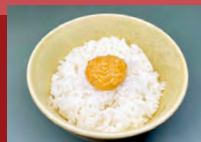
めんたいマヨごぼん Vegan Mentaiko Mayo Rice