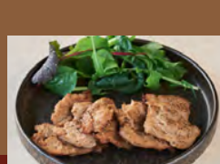
大豆ミートチャーシュー Soy Meat Chashu (Seared)