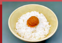
めんたいごぼん Vegan Mentaiko Rice