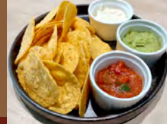
トルティーヤチップス Tortilla Chips