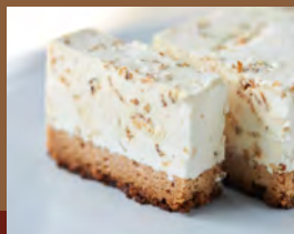
キャラメルナッツムースケーキ Caramel Nut Mousse Cake