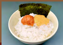
めんたいごぼんダブル (のり付き) Vegan Mentaiko Double Rice with seaweed