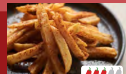
フライドポテト チリ Spicy Chili Fries