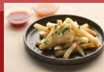
フライドポテト French Fries