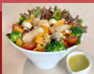
ビストロサラダ Bistro Salad