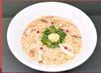
ノンオイル 京都けいらん風ヌードル Non-oil Kyoto Keiran-style Noodle

グルテンフリー麺替え玉 +¥350 extra Gluten-Free Noodles