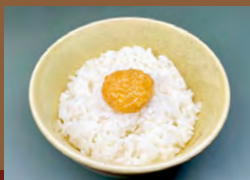
めんたいマヨごぼん Vegan Mentaiko Mayo Rice