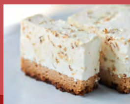
キャラメルナッツムースケーキ Caramel Nut Mousse Cake