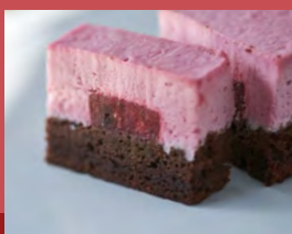
ラズベリームースショコラケーキ Raspberry Mousse Chocolate Cake