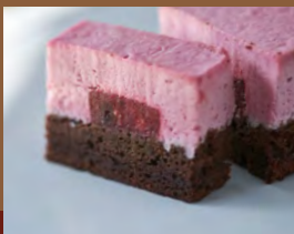
ラズベリームースショコラケーキ Raspberry Mousse Chocolate Cake