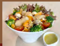
ビストロサラダ Bistro Salad