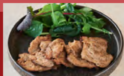
大豆ミート チャーシュー Soy Meat Chashu (Seared)