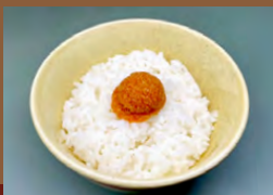
めんたいごぼん Vegan Mentaiko Rice