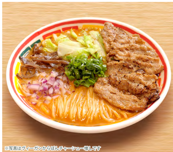
※写真はヴィーガンからぼんチャーシュー増しです