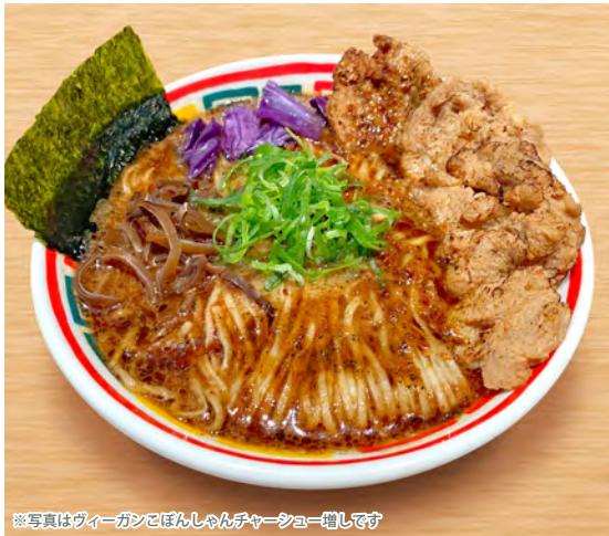
※写真はヴィーガンこぼんしゃんチャーシュー増しです