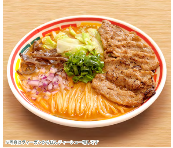
※写真はヴィーガンからぼんチャーシュー増しです