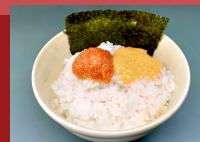
めんたいごダブルごはん (のり付き) Vegan Mentaiko Double Rice with seaweed