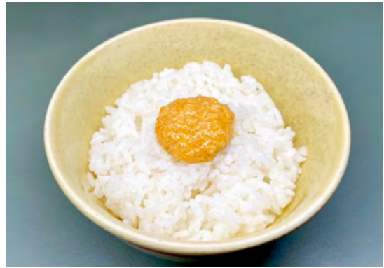
めんたいマヨごはん