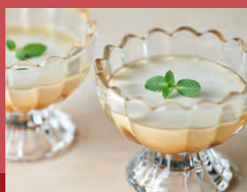
豆乳プリン (甜菜糖シロップがけ) Soy Milk Pudding with beet sugar syrup