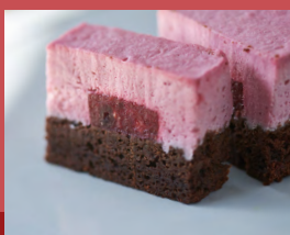
ラズベリームースショコラケーキ Raspberry Mousse Chocolate Cake