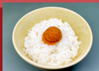
めんたいごはん Vegan Mentaiko Rice