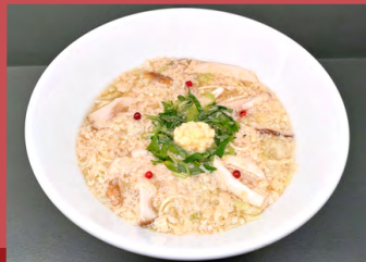
ノンオイル 京都けいらん風ヌードル Non-oil Kyoto Keiran-style Noodle

グルテンフリー麺替え玉 +¥350 extra Gluten-Free Noodles