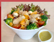
ビストロサラダ Bistro Salad