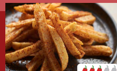
フライドポテト チリ Spicy Chili Fries