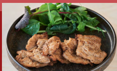
大豆ミート チャーシュー Soy Meat Chashu (Seared)