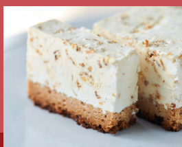
キャラメルナッツムースケーキ Caramel Nut Mousse Cake