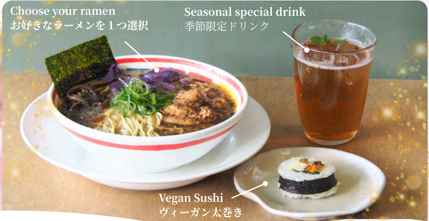
Vegan Sushi ヴィーガン太巻き