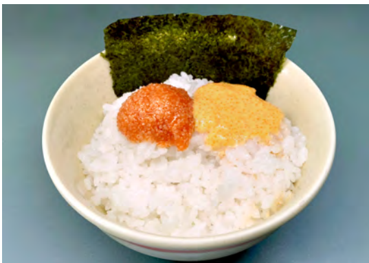
めんたいこダブルごはん(のり付き)