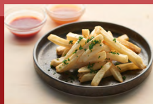
フライドポテト French Fries