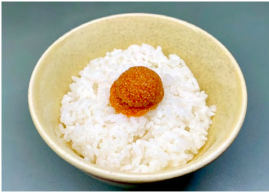
めんたいこごはん

What is "Mentaiko"? It's about spicy fish eggs. We have reproduced the same taste with vegan ingredients.