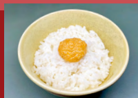
めんたいマヨごはん Vegan Mentaiko Mayo Rice