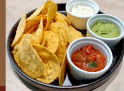
トルティーヤチップス Tortilla Chips