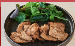
大豆ミート チャーシュー Soy Meat Chashu (Seared)