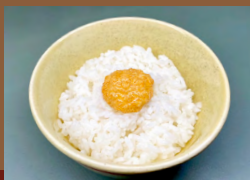
めんたいマヨごぼん Vegan Mentaiko Mayo Rice