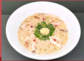
ノンオイル 京都けいらん風ヌードル Non-oil Kyoto Keiran-style Noodle

グルテンフリー麺替え玉 +¥350 extra Gluten-Free Noodles