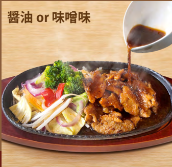
醤油 or 味噌味 ジュージュグリル Juju Grill - Soy meat grilled on an iron plate

ソイミートWダブル additional soy meat +¥400 ごはん rice +¥200 野菜Wダブル additional vegetables +¥300 ごはん大盛 large size rice +¥300