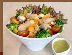
ビストロサラダ Bistro Salad