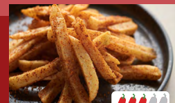
フライドポテト チリ Spicy Chili Fries