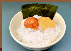
めんたいごぼん (のり付き) Vegan Mentaiko Double Rice with seaweed