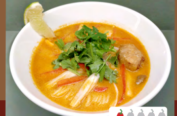
シンガポールラクサ Singapore Laksa

グルテンフリー麺替え玉 extra Gluten-Free Noodles +¥350 追い飯 (50g) small size rice +¥100 追加パクチー extra cilantro +¥200