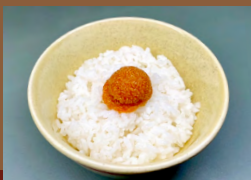
めんたいごぼん Vegan Mentaiko Rice