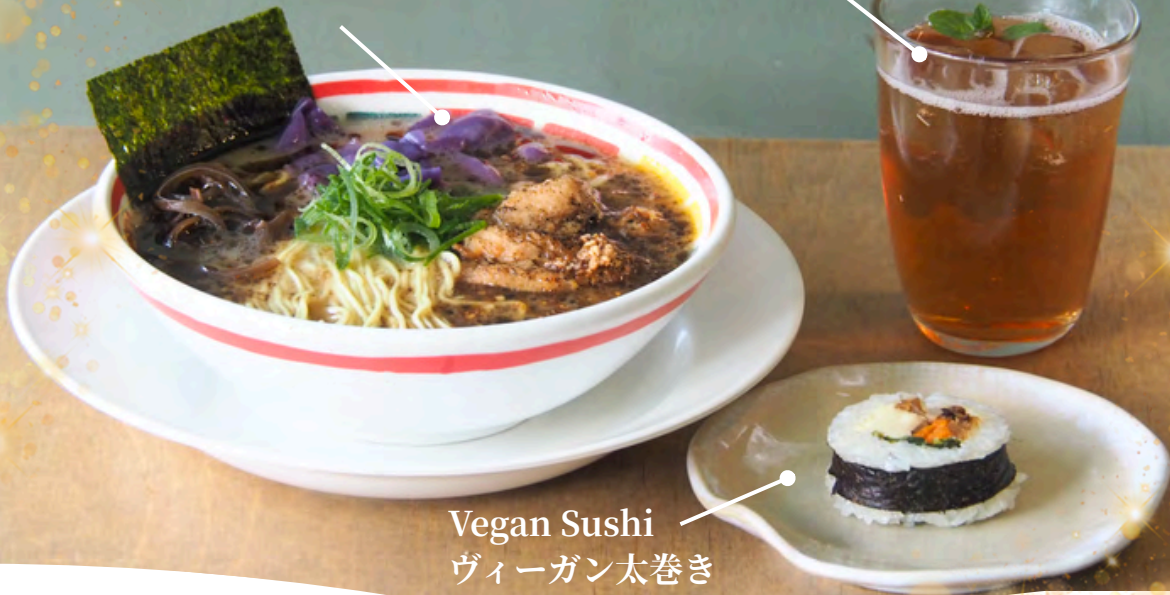
Vegan Sushi ヴィーガン太巻き