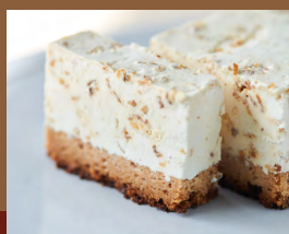
キャラメルナッツムースケーキ Caramel Nut Mousse Cake