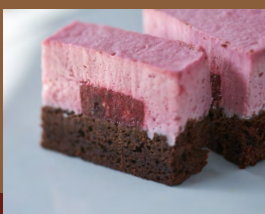
ラズベリームースショコラケーキ Raspberry Mousse Chocolate Cake