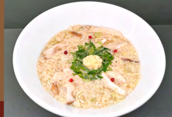
ノンオイル 京都けいらん風ヌードル Non-oil Kyoto Keiran-style Noodle

グルテンフリー麺替え玉 extra Gluten-Free Noodles +¥350