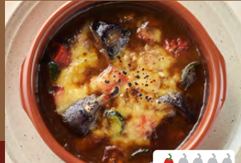
焼きチーズカレー Grilled Cheese Curry