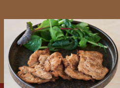
大豆ミートチャーシュー Soy Meat Chashu (Seared)