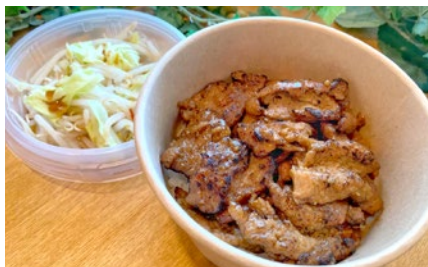
ジュージューグリル丼 (醤油味 or 味噌味) Rice bowl with grilled soy meat ¥1200