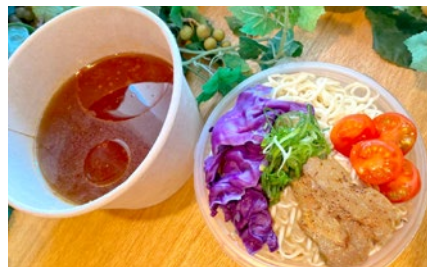
ニューロー麺 Taiwanese spicy noodle ¥1100