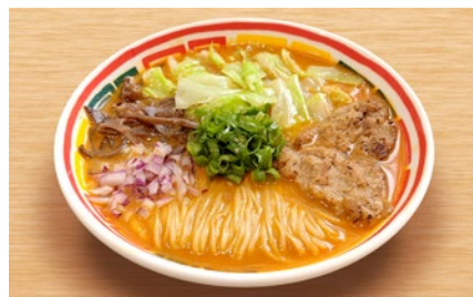
ヴィーガンからぼん Vegan Karabon ¥1170