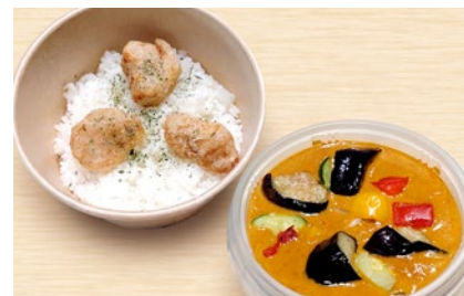
マッサマンカレー 五可 Massaman Curry ¥1350