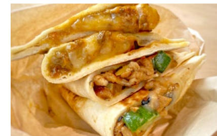
ケサディーヤ Quesadilla ¥1150