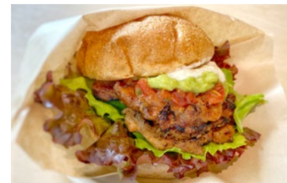
グリルバーガー (醤油味 or 味噌味) Grilled Soy Meat Burger ¥1050